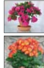
PIANTA FIORITA AZALEA / BEGONIA