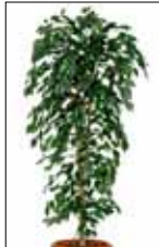
PIANTA VERDE FICUS BENJAMINA h 2 mt