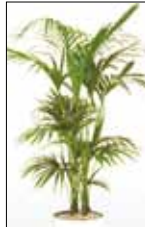
PIANTA VERDE KENTHIA h 1,5 / 2 mt